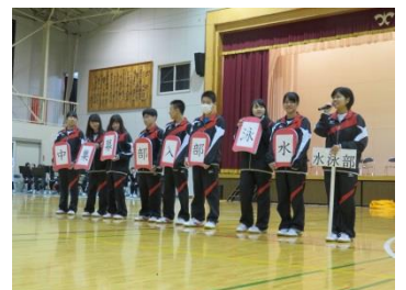
水泳部の活動紹介